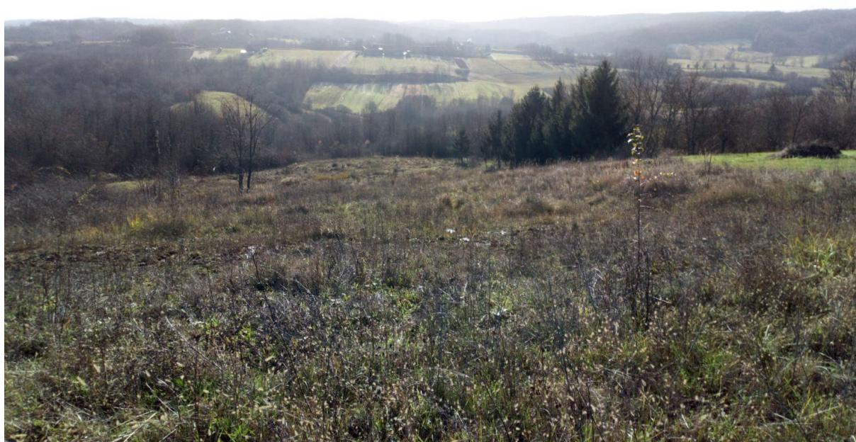
Slika 1. zemljište u vlasništvu dužnika

Zakonskog zastupnika kontaktirano je u više navrata i na više načina, komunikacija je uspješna, te zakonski zastupnik dužnika do otvaranja stečajnog postupka u svemu uredno surađuje sa stečajnim upraviteljem. Zemljište u vlasništvu dužnika fizički je pohađeno i fotografirano. Fotografija zemljišta prikazana je na slici 1.